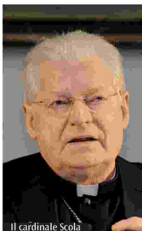
Il cardinale Scola

Ingresso libero su prenotazione on line ( www.chiesadimilano.it/comunicazionisociali ). Scrive nel volume il cardinale Scola: «Le situazioni che viviamo oggi pongono sfide nuove che per noi a volte sono persino difficili da comprendere. Questo nostro tempo richiede di vivere i problemi come sfide e non come ostacoli: il Signore è attivo e all'opera nel mondo». Queste parole, pronunciate da papa Francesco al Convegno ecclesiale di Firenze, offrono un prezioso suggerimento per guardare al grande travaglio che caratterizza questo inizio di terzo millennio. Uno degli aspetti più vistosi del "cambiamento d'epoca" di cui parla il Papa è il tumultuoso processo di mescolamento di popoli e culture in cui oggi siamo immersi. Più di dieci anni orsono, proposi di descrivere questo processo con l'ardita metafora del "meticciato di civiltà e culture", da intendere come "mescolanza di culture e fatti spirituali che si producono quando civiltà diverse entrano in contatto". L'umana avventura della libertà di ogni singolo e di ogni popolo non fa che mostrare la profondità dell'amore di Dio che ha scelto, per comunicarsi, di passare, con la croce di Cristo, attraverso la libertà finita e il suo continuo vagabondare».