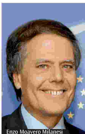
Enzo Moavero Milanesi