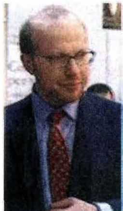
Stepan Solženicyn fotografato al Salone del libro di Torino